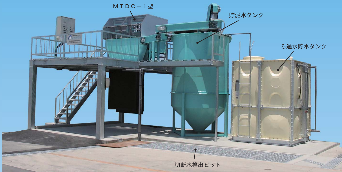
アスファルト切断廃液の集中脱水処理施設